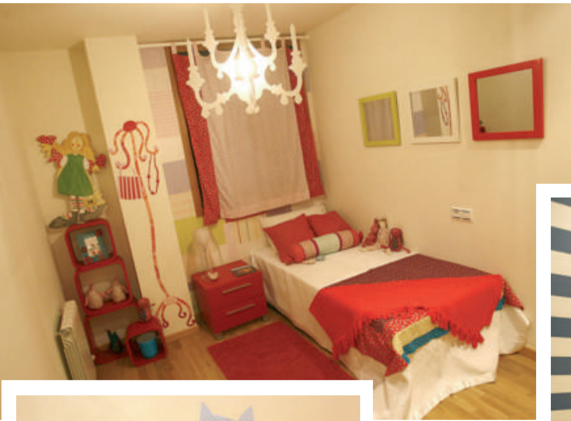
Sobre estas líneas, el estar. A la izquierda, una habitación infantil y, debajo, detalle de la misma. A la derecha, dos imágenes del cuarto inspirado en motivos marineros.