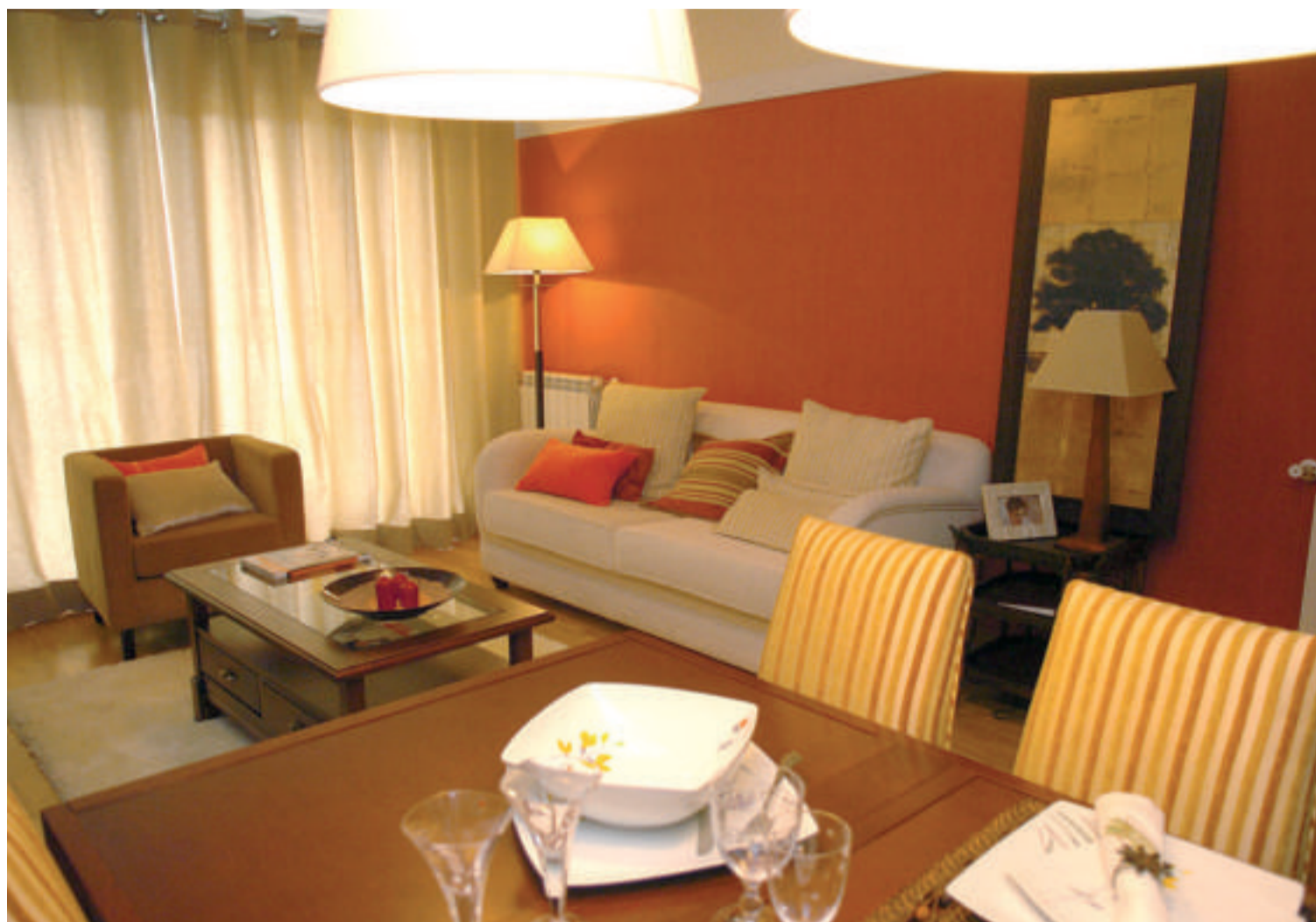
Vista del estar desde el comedor. El papel naranja se remata con un moldura lacada en blanco antes de alcanzar el techo.

El baño común está revestido con azulejos que imi-