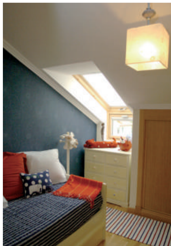
Las dos habitaciones de la vivienda son abuhardilladas.