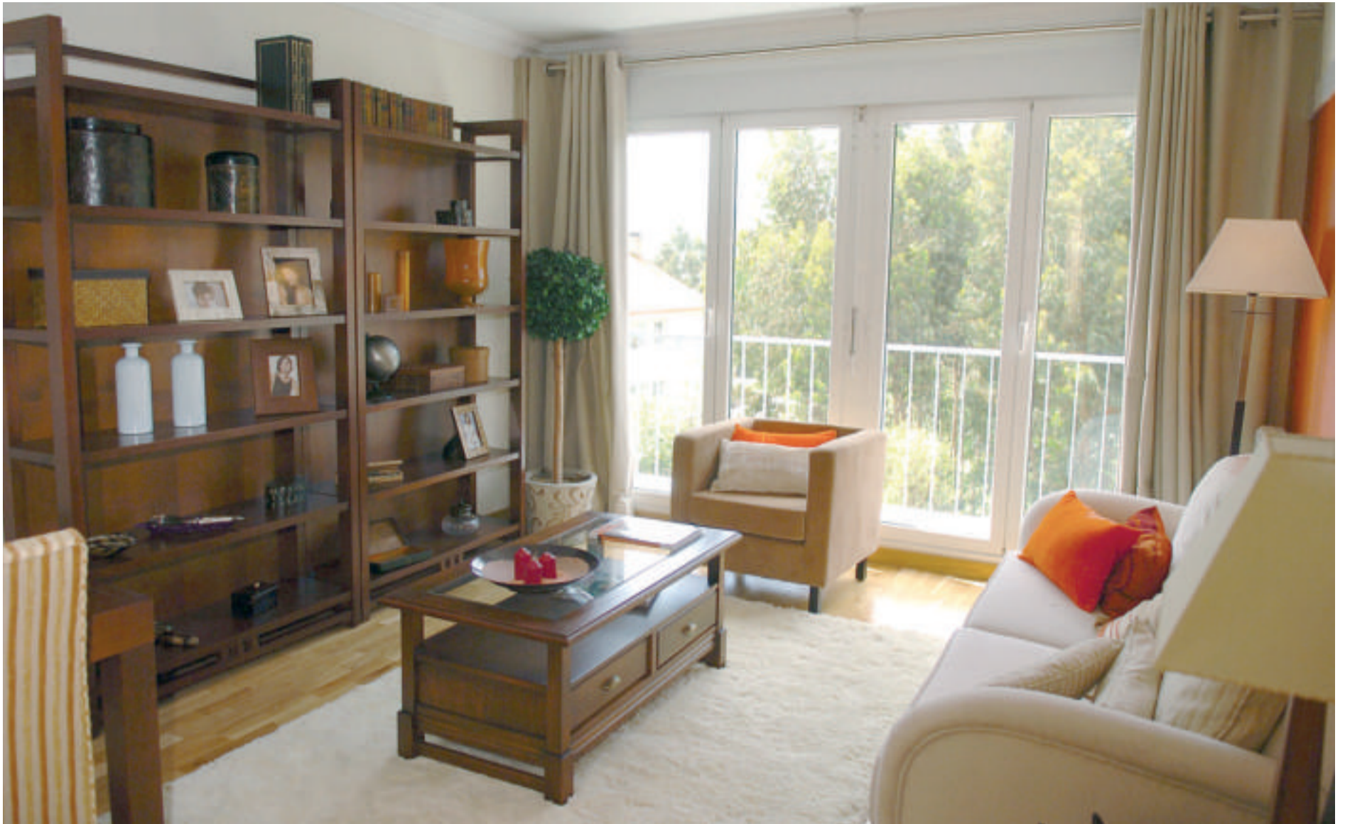
Los tonos tierra y el naranja aportan luminosidad y restan sobriedad al mobiliario oscuro del salón comedor.