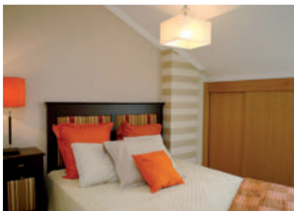
La columna del dormitorio llega a integrarse en la decoración.