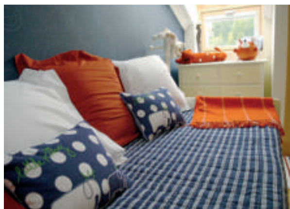
Tejidos coordinados en el cuarto infantil.