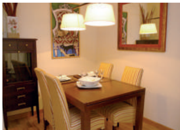
Detalle del comedor de la vivienda.