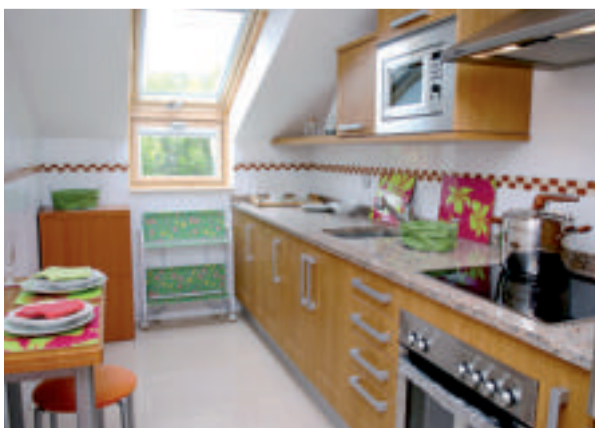
La cocina se dotó de divertidos complementos.